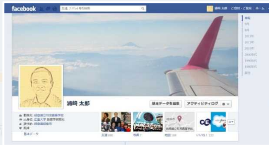
Facebook の活用 (H23.8~)