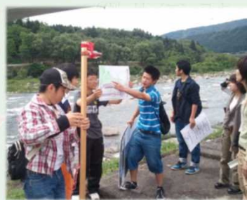
阿寺断層研究会 (中学生を地域の ゲストからホストに) (H21.9~)