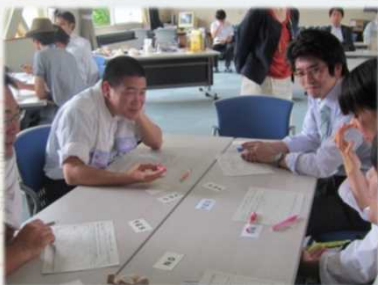
リーダー養成 防災クロスロード (H24.6)