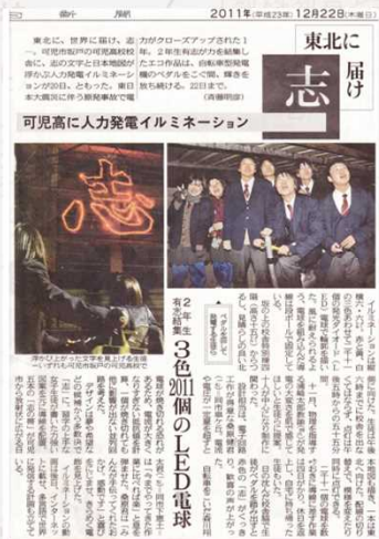
人力発電イルミネーション 物理×共同制作 (H23.12)