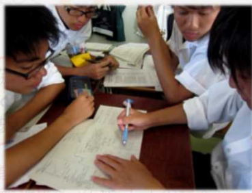
Active Learning による 入試対策 (H24.7~)